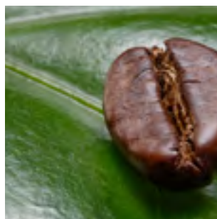
MISSION E VALORI PAG.07