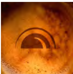
CHI SIAMO PAG.04