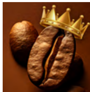
SERVIZI PREMIUM PAG.16